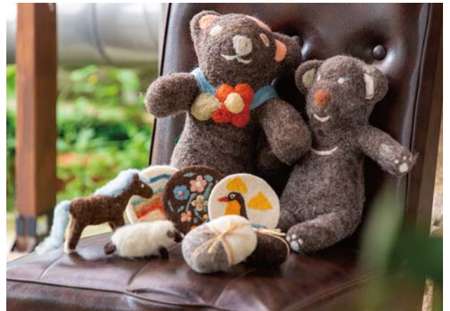
羊毛の雑貨は多くの利用者さんの手を経て完成し、cafeこぼちよに並びます。

富士宮市栗倉2735-147 ☎ 0544-21-7133 ● 平日 11:00~15:00、土・日・祝日 10:00~16:00 ● 休 火・水曜日、日曜日不定休